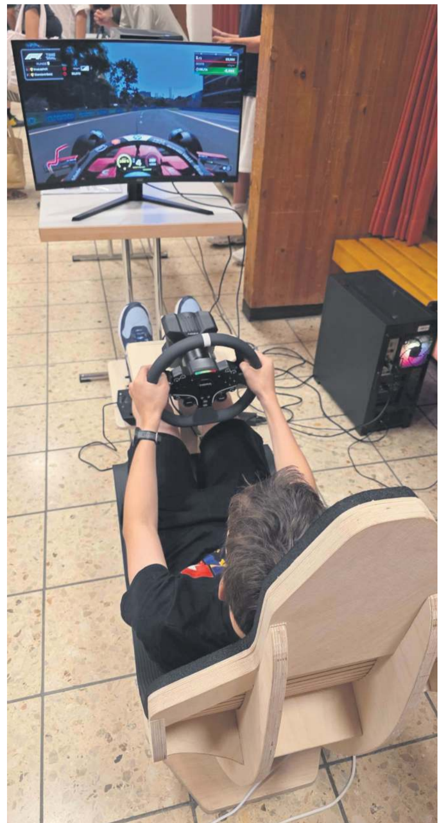
Ein Jugendlicher testet den Playseat eines 3. Seklers.