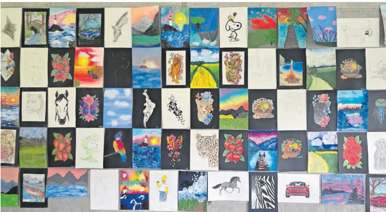
Arbeiten der 1. Sek aus dem Bildnerischen Gestalten.