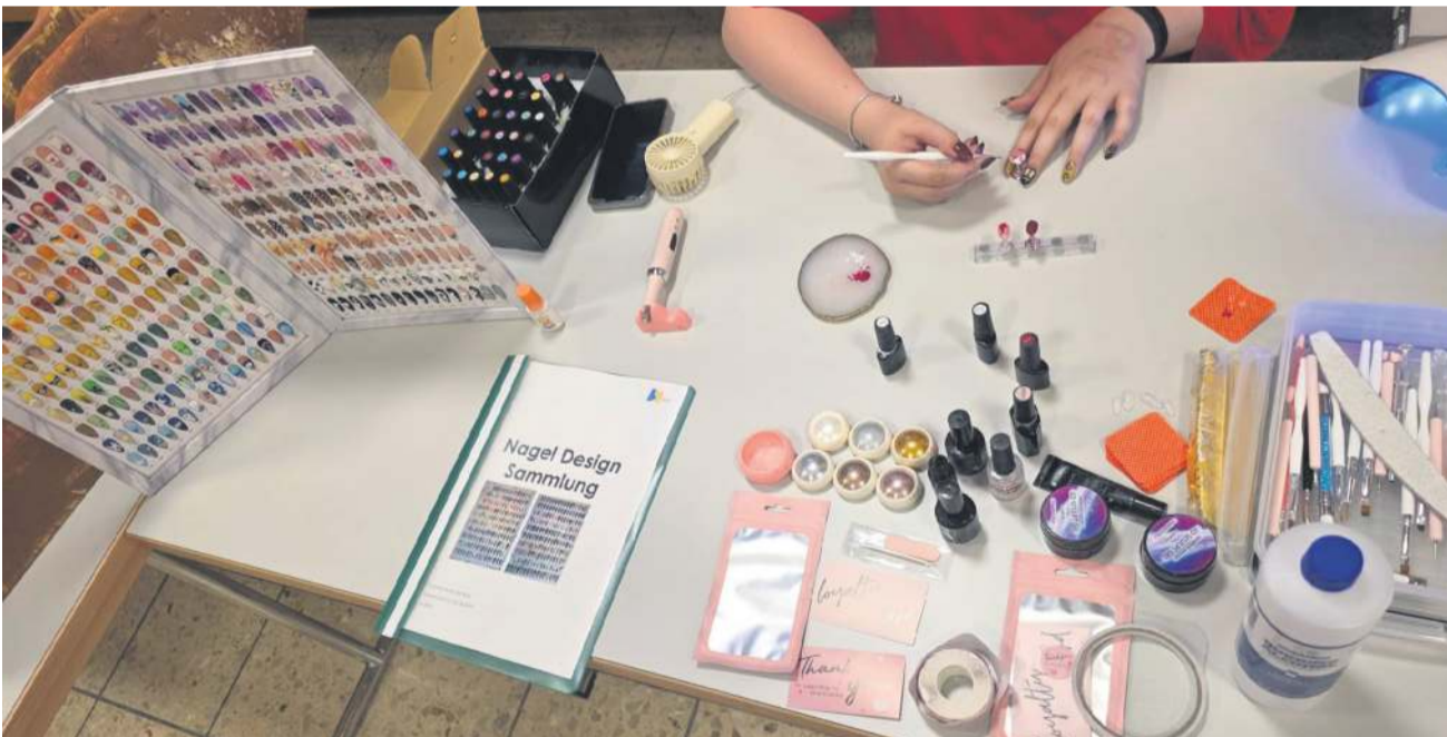
Eine Schülerin der 3. Sek kreierte Nail-Art.